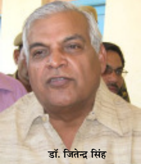
डॉ. जितेन्द्र सिंह